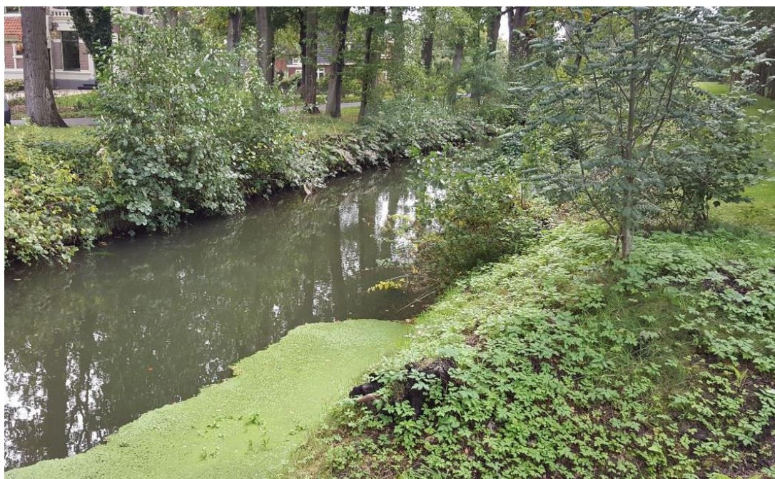
Figuur 4: Foto locatie tijdens veldbezoek op 2 oktober 2018 (bovenstroomse zijde).