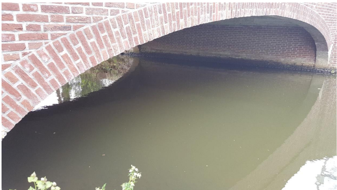
Figuur 3: Foto locatie tijdens veldbezoek op 17 april 2019.