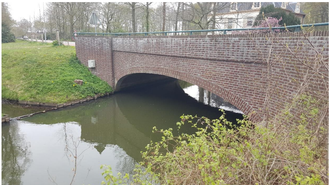
Figuur 2: Foto locatie tijdens veldbezoek op 17 april 2019.