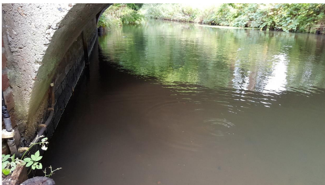
Figuur 5: Foto locatie tijdens veldbezoek op 2 oktober 2018 (benedenstroomse zijde).